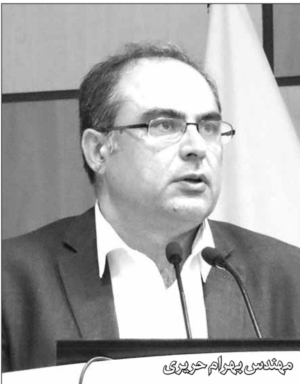
مهندسین بهرام حریری

اردیبهشت ۹۴، مجمع عمومی جامعه متخصصین نساجی ایران با برگزاری انتخابات اعضای هیئت مدیره همراه بود. هیئت مدیره جدید با ترکیبی از صنعتگران و دانشگاهیان تصمیم دارد ضمن حرکت در مسیر شعار همیشگی این تشکل مهندسی یعنی «با هم بودن آغاز است، با هم ماندن پیشرفت و با هم کار کردن موفقیت»، با راهاندازی و تقویت کمیته های تخصصی جایگاه ویژه و قابل تأملی در میان متخصصین نساجی به وجود آورد. جایگاهی که به ارائه خدمات بیمه ای و تورهای مسافرتی محدود نمی شود و بیشتر رنگ و بوی حمایت از منافع متخصصین در واحدهای تولیدی، افزایش تعداد اعضا و تأثیرگذاری بیشتر در اذهان دولتمردان و تصمیم گیران کلان کشور دارد. به مناسبت آشنایی با برنامه ها، تصمیمها و چشم انداز هیئت مدیره جدید جامعه، گفت‌وگویی با دبیر، رئیس و نایب رئیس هیئت مدیره در دفتر جامعه انجام دادیم آن هم در شرایطی که به دلیل برگزاری جلسه هیئت مدیره، سایر اعضای اصلی و علی البدل نیز کم و بیش در جریان این مصاحبه قرار گرفتند!